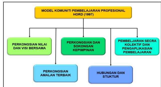
Rajah 2. Model Pembelajaran Profesional Hord (1997).

Dalam kajian ini, model Pembelajaran Profesional Hord (1997) telah digunakan. Model ini adalah salah satu model yang paling popular dan paling terkini dalam kalangan penyelidik yang mengukur amalan KPP. Terdapat lima dimensi yang diperkenalkan oleh Hord secara menyeluruh dan merangkumi pelbagai aspek. Pertama adalah perkongsian nilai dan visi bersama untuk mengekalkan budaya pembelajaran dalam kalangan pemimpin, guru dan fokus utamanya adalah pelajar itu sendiri (Reichstetter, 2006). Kedua, perkongsian dan sokongan kepimpinan mempunyai pengaruh yang kuat dan positif kepada guru untuk berkongsi idea dalam mencapai visi dan misi sekolah. Ketiga, pembelajaran secara kolektif membenarkan pengetahuan baharu sekaligus berlaku pengaplikasian pembelajaran di dalam bilik darjah. Keempat, perkongsian amalan terbaik berdasarkan pengalaman guru dapat menggalakkan amalan kolaboratif. Akhir sekali, hubungan baik serta struktur sekolah juga membantu pelaksanaan KPP secara maksimum.