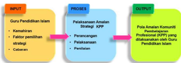
Rajah 1. Kerangka Konseptual diadaptasi daripada Noraini (2015).

Input bagi kajian ini ialah guru pendidikan Islam yang telah mengajar di sekolah yang melaksanakan Program TS25. Bagi proses pula, kajian ini akan melihat dari segi pelaksanaan amalan strategi KPP dalam kalangan guru bermula dari perancangan, pelaksanaan dan penilaian. Akhirnya kajian ini akan menghasilkan output iaitu Pola Amalan KPP yang dilaksanakan oleh GPI.