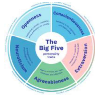
Rajah 2. Teori The Big Five Personality

Teori seterusnya yang berkaitan dengan personaliti introvert ialah teori The Big Five Personality yang menjadikan lima elemen utama sebagai tunjang pembentukan personaliti seseorang individu. Bagi kajian ini saya memfokuskan elemen extraversion yang berkait rapat dengan personaliti introvert. Extraversion atau ekstraversi adalah trait personaliti yang menunjukkan ciri-ciri individu yang sukakan keseronokan, mudah bergaul, suka bercakap dan tegas. Tambahan pula, individu yang mempunyai sifat ekstraversi yang tinggi adalah seorang yang suka bergaul dan cenderung memperoleh tenaga dalam situasi sosial. Menurut Aiman & Aqila (2022) ekstrovert mendapat tenaga apabila dapat bersosial dengan orang yang dikenali dan termasuk juga orang yang baru sahaja dikenali berbanding introvert yang mendapat tenaga apabila melakukan aktiviti yang disukai secara bersendirian. Maka, introvert yang dikategorikan dalam golongan yang mempunyai ekstraversi yang rendah cenderung menjadi pendiam dan kurang gemar akan majlis yang memerlukan mereka untuk bersosial. Ini kerana, apabila mereka bersosial tenaga mereka akan berkurang dan memerlukan masa bersendirian bagi mengecbas semula tenaga mereka. Bagi konteks kajian ini, guru pelatih yang introvert digambarkan sebagai guru yang tidak mesra dan membosankan kerana tidak pandai bergaul dengan murid-muridnya.